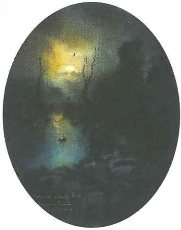
Magha Moon and a Lonely Bird. วาดโดย ศ.ดร.สมภาร พรหมทา (หน้า ๑๓)