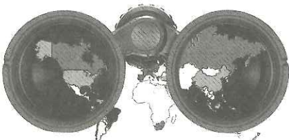
เก็บเบี้ยใต้ถุนร้าน