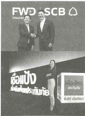
ประกันชีวิต ประกันภัย