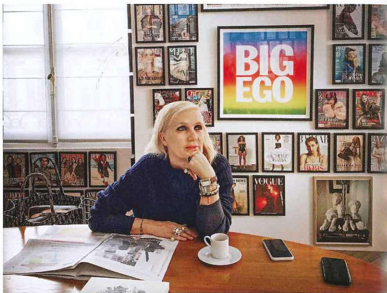
มาเรีย กราเซีย คิวรี เป็นผู้หญิงคนแรกที่ก้าวสู่ตำแหน่งผู้อำนวยการศิลปะของคริสเตียนดิออร์ แบรนด์แฟชั่นอายุ 72 ปี