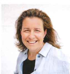
คลอเดีย คัลบ์ นักเขียน หน้า 104

ฉันพยายามมองโลกผ่านผู้คนที่อยู่ในเรื่องราวและชีวิตของฉันทึ่งมุมมองของพวกเขาที่น่าไปสู่ความรู้ใหม่ๆ ที่ไม่คาดคิด