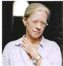
ลินน์ จอห์นสัน ช่างภาพ หน้า 52