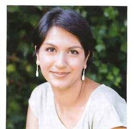
แองเจลา โซนิ นักเขียน หน้า 96

ฉันอ่านคนเก่ง และมักจะจับได้ทันที ถ้าใครโกหกฉัน