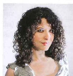
ดีนา ลีทอฟสกี ช่างภาพ หน้า 104

ฉันมองหามุมไม่คาดฝัน อะไรที่อยู่เหนือความผิวเผิน หรือค้นหาแง่มุมน่าสนใจในความทันสมัยและคุ้นเคย