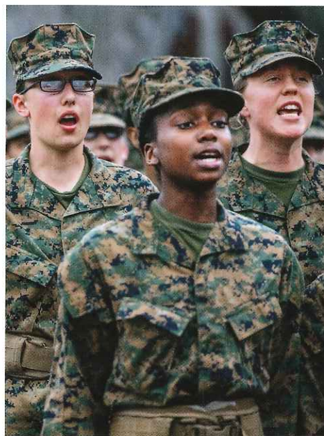
ทหารนาวิกโยธินใหม่ซึ่งทั้งหมดเป็นผู้หญิงได้รับการฝึกที่ค่ายบนเกาะแพริส ในเซาท์แคโรไลนา การฝึกที่เข้มข้นเป็นพิเศษซึ่งบังคับสำหรับทหาร นาวิกโยธินทั้งชายและหญิงที่มีชื่อเรียกพิเศษว่า "ภาคเบ้าหลอม"

ในโครงการสร้างพื้นที่ปลอดภัยให้ผู้หญิง และเพิ่ม บทลงโทษผู้กระทำความผิด หน้า 84 เรื่อง นิลัญญา ไกร์มิก ภาพถ่าย สมญา ชันเทลวัล