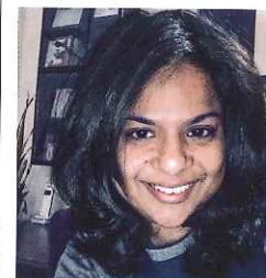
บิลิญนา โกว์มิก นักเขียน หน้า 84

ฉันจะมองลึกลงไปกว่าสิ่งที่เห็นชัดเจนและใจแจ้ง และเปลี่ยนประสบการณ์เป็นเรื่องราวที่มีความหมาย