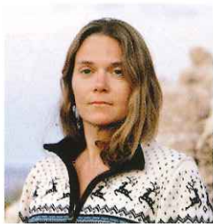
เอริกา ลาร์เซน ช่างภาพ หน้า 31

ความเชื่อในสิ่งที่ฉันมองไม่เห็นหรือได้ยิน แต่ในสิ่งที่ฉันรู้สึก