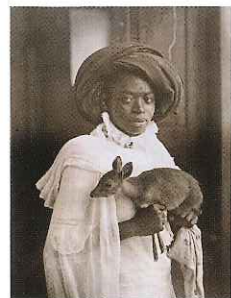
หญิงสาวคนหนึ่งกับสัตว์เลี้ยงของเธอ นั่นคือลูกแพนด้าโลก