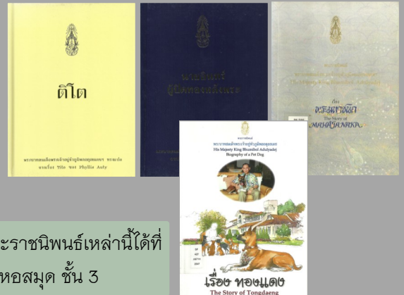
อ่านหนังสือพระราชนิพนธ์เหล่านี้ได้ที่ สำนักหอสมุด ชั้น 3

ตลอดระยะเวลาอันยาวนานตั้งแต่พระบาทสมเด็จพระปรมินทรมหาภูมิพลอดุลยเดช ขึ้นครองสิริราชสมบัติ ถึงแม้ว่าพระองค์ทรงมีพระราชกรณียกิจมากมาย แต่ก็มิงานพระราชนิพนธ์ออกมาอย่างต่อเนื่อง หนังสือพระราชนิพนธ์แสดงให้เห็นถึงพระปรีชาสามารถด้านวรรณกรรม ได้แก่ “พระมหาชนก” “ทองแดง” และ “ทองแดงฉบับการ์ตูน” และพระราชนิพนธ์แปลเรื่อง “นายอินทร์ผู้ปิดทองหลังพระ” และ “ดีโต” ก็ล้วนเพียงพอร่วมด้วยเนื้อหาสาระ แฝงข้อคิดและมีความงดงามของภาษา